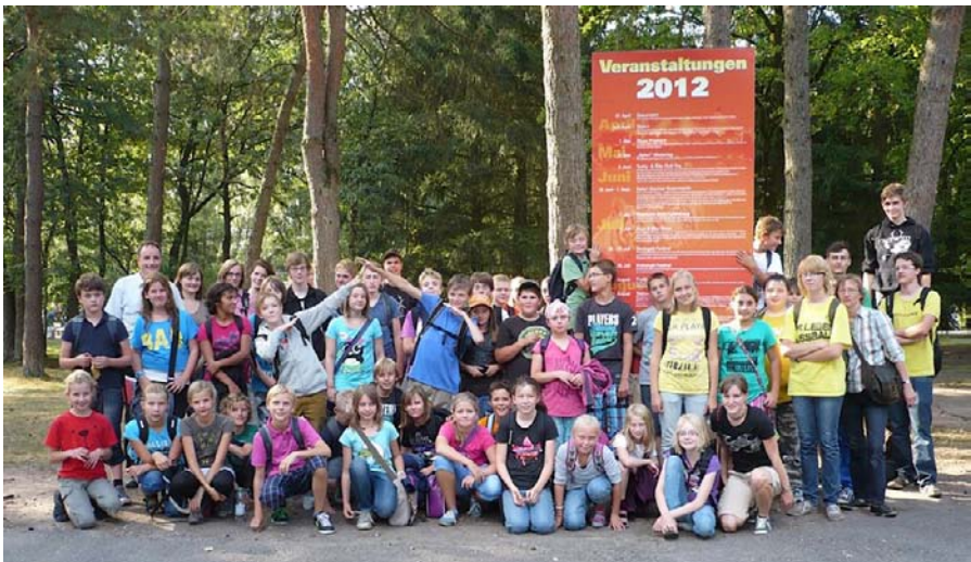
Messdienerausflug 2012 in den Safari Park

Nach der Messe stehen unsere Messdienerinnen und Messdiener an den Ausgängen und bitten um eine finanzielle Unterstützung der Messdienerarbeit in unseren Gemeinden. Mit dieser Unterstützung werden die jährliche "Danke Schön Fahrt" (in diesem Jahr fahren wir nach Dortmund ins DASA Museum mit anschließendem Stadtbesuch), die Aktivitäten der Messdienertreffen und auch das Material für die Ausbildung mit finanziert. Wir möchten Sie bitten, den wichtigen Dienst der Kinder und Jugendlichen zu unterstützen. Auf diese Weise signalisieren wir als Gemeinde auch wie wichtig uns der Dienst der Ministrantinnen und Ministranten ist. Vielen Dank